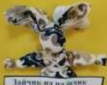
«Зайчик на пальчик»